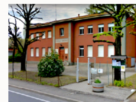
Centro Civico di Rastignano