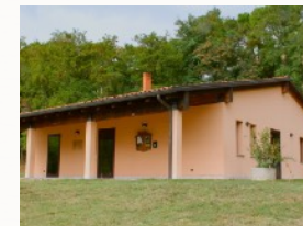
Sede AGESCI a Castel S. Pietro Terme