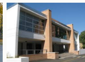
Istituto "E. Mattei" S. Lazzaro di Savena