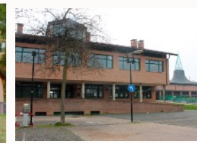
Biblioteca di Ozzano dell'Emilia