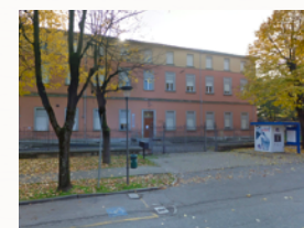
Biblioteca di Castel Guelfo