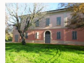
Villa Pasi Medicina