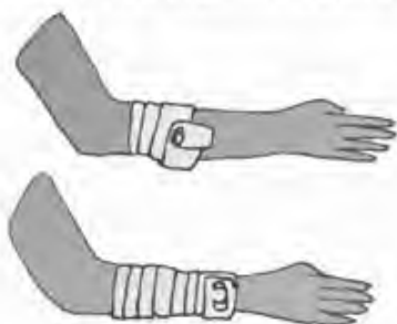
fasciatura di un segmento di un arto

Se la fonte di calore è ancora attiva al momento del soccorso è bene eliminare gli abiti, ma non quelli a contatto con l'ustione: si rischia di staccare insieme agli abiti anche l'epidermide e aggravare la situazione.